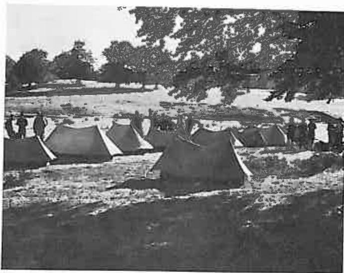
Acampado en Legaire

El "Día del Recuerdo", en Besaide, se disfrut3 de un tiempo no corriente en esta fecha, que hizo que los miles de montaÑeros que en este día acudieron a orar por las almas de nuestros amigos, disfrutaran de las magníficas vistas que este bello lugar ofrece.