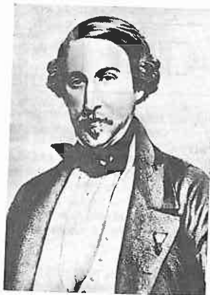
SEBASTIAN IRADIER y SALAVERRI Compositor

composiciones (ya que en el próximo Diciembre se cumple el centenario de su nacimiento). En este número ofrecemos, de un modo sinóptico , en esta doble página, así como los datos biográficos de sus vidas,