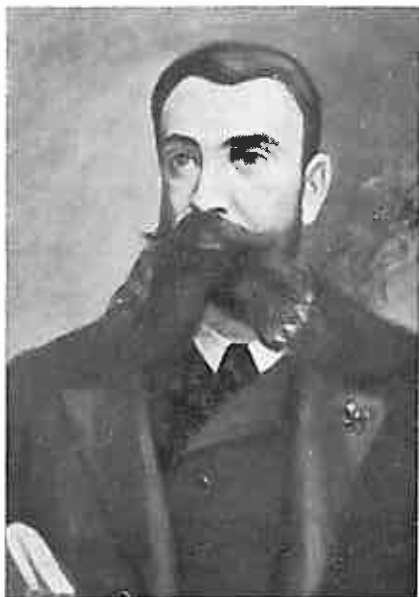
MANUEL IRADIER Y BULFY Explorador (Cuadro de Aldecoa)