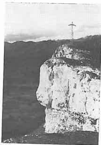
Conjunto y detalle de la Cruz de Mirutegui

guipuzcoanos sus fervientes promesas de volver a Legaire, que bien merece el nombre de PARQUE ALAVES, y que estimamos debiera llegar a serlo. POR QUE NO...?