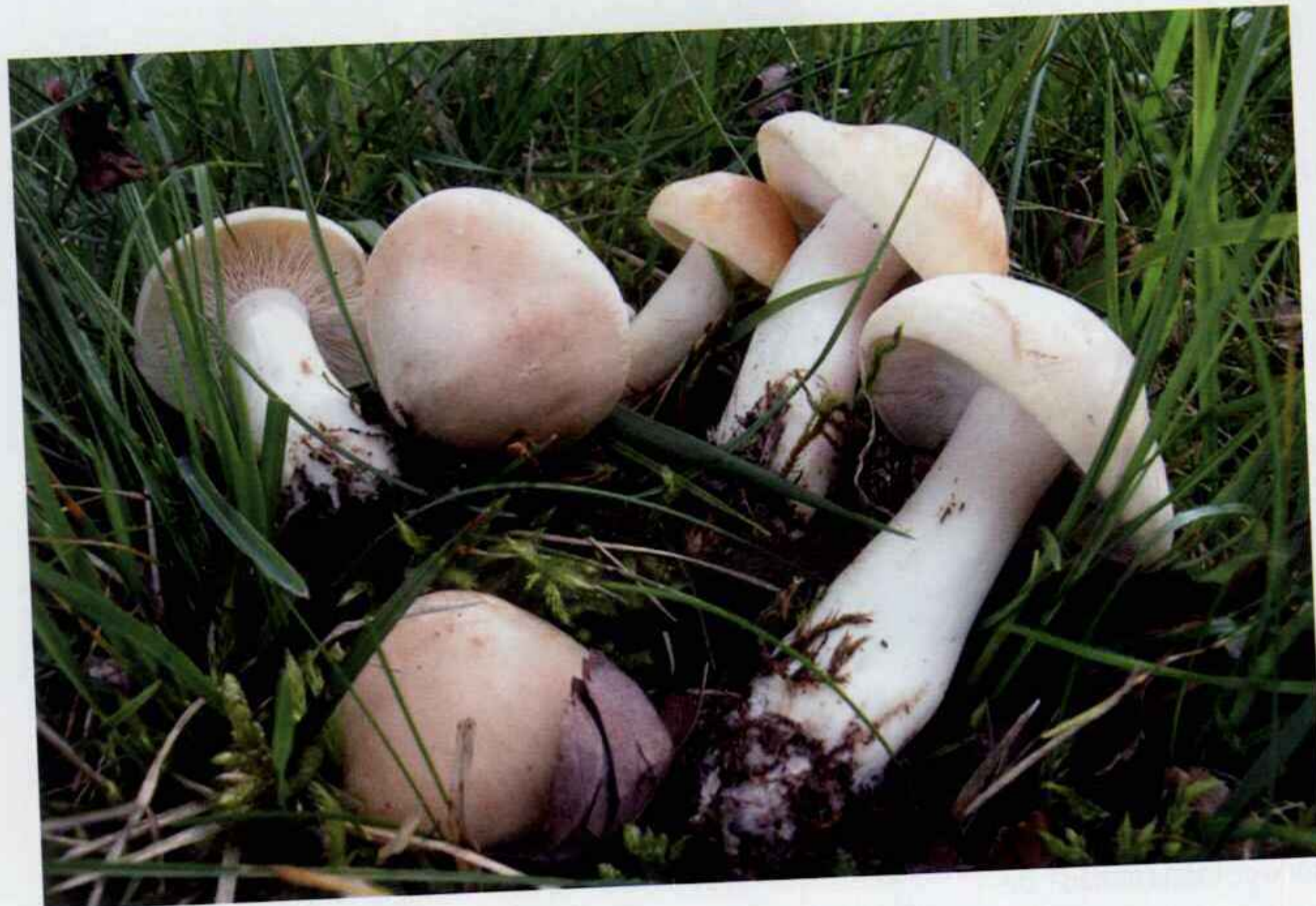
Calocybe gambosa (Brig.) Singer

SINÓNIMOS (Nombres antiguos de esta seta):