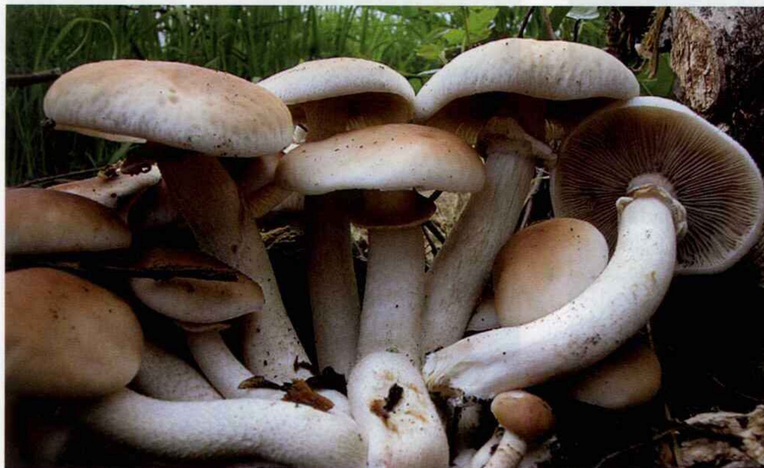
Agrocybe aegerita (Brig.) Singer